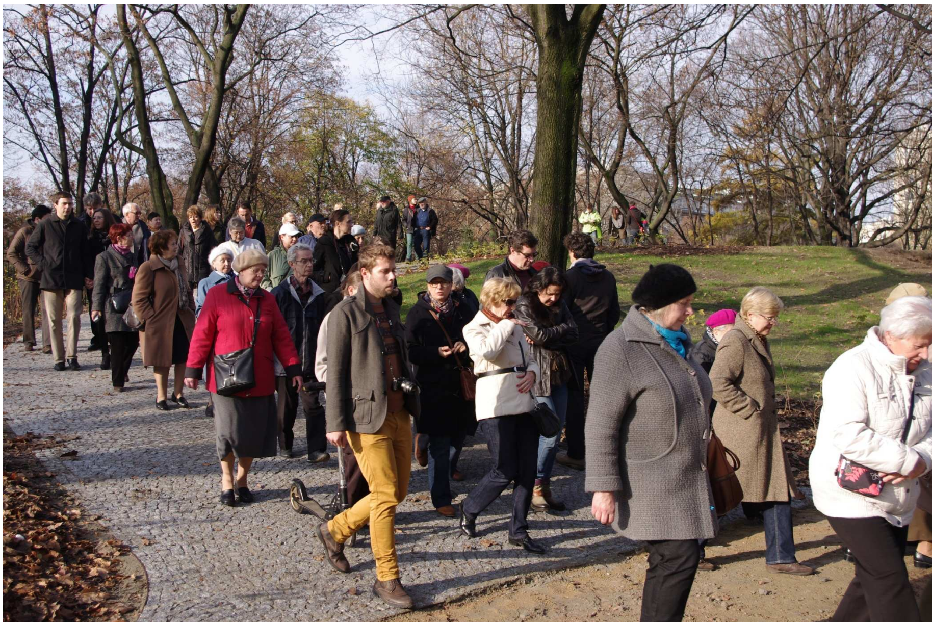
Spacer po Ogrodzie Krasińskich – 9 listopada 2013 r.